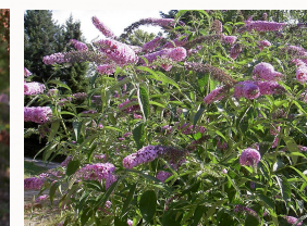
Arbuste de buddleia de Ikai (Wikicommon)