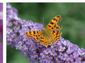
Robert le diable/Gamma sur buddleia de BranK (pxhere)