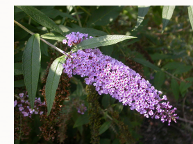
Inflorescence de buddleia

Mesures de gestion non chimique : arrachage manuel (plante et racine) des jeunes individus dès le début du printemps, coupe des inflorescences avant fructification, dessouchage des arbustes avec précaution (risque de bouturage), évacuation des plantes en déchèterie pour incinération, surveiller la zone durant 2 ans.