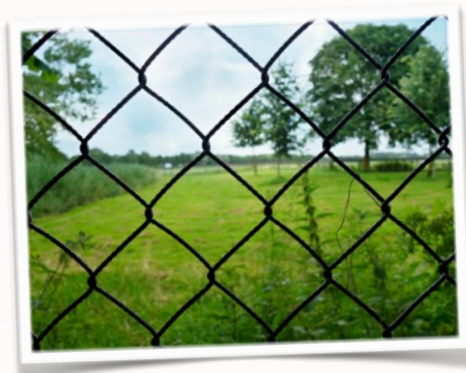
Grillage sur prairie