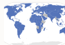
Pays signataires de la Convention de Berne

Classement UICN : préoccupation mineure (LC)