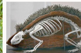
Squelette de hérisson de Ryan Somma Wikimedia common