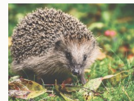
Hérisson d'Europe de Alexas_Fotos

Il est présent dans toute l'Europe de l'Ouest et jusque dans les Balkans. Généraliste, il peut vivre dans tous types de milieux et affectionne les haies, buissons, plantes couvre-sols, herbes sèches entremêlées, petits bosquets, prairies à herbe courte. Il se confectionne un nid d'été (herbes, feuilles, plantes...) et un nid d'hiver (structure compacte en écaille à base de feuilles).