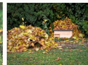
Maisons de hérisson de Alexas_fotos